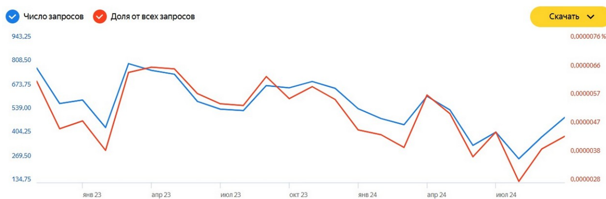
Рисунок 2. График пользовательских запросов по теме «цифровое бессмертие», ноябрь 2022 г. – октябрь 2024

Третья группа включает в себя теги, связанные со сферой искусственного интеллекта и цифровых технологий: #искусственныйинтеллект; #нейросети; #цифровизация. Рост случаев тег-синтеза бессмертия и цифровых ресурсов объясняется частыми информационными вбросами, систематическим воспроизводством интернет-контента с обсуждением «минусов» и «плюсов» цифрового бессмертия. Динамика поисковых запросов по данным “WordStat” (сервис «Яндекс») колеблется с 2022 г. в диапазоне от 200+ до 800+ ежемесячно. Однако уже беглый взгляд на двухлетний график запросов позволяет фиксировать небольшой спад пользовательской активности вокруг «цифрового бессмертия». Есть предположение, что спорадический рост стимулируется производством художественного контента (прежде всего, сериалами).